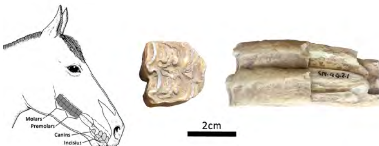
Figura 3: Molar o premolar de cavall (Id. 49) de Sa Fundació

El cavall presentava a la prehistòria una àmplia distribució a la Mediterrània i, ara per ara, no es pot precisar des d'on va ser introduït a Mallorca o a les Balears (Ramis, 2017).