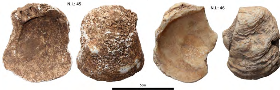
Figura 1: Exemplars de S. gaederopus de Sa Fundació

Efremov (1940), i és l'estudi que permet esbrinar i reconstruir els diferents processos que s'han produït abans, durant i després de la mort i l'enterrament d'un organisme fins a la seva recuperació en una campanya paleontològica o arqueològica. La tafonomia inclou tant els processos naturals com els culturals. En aquest sentit, s'ha convertit en una eina indispensable en qualsevol l'estudi paleontològic o arqueològic, pel que fa a les restes biològiques.