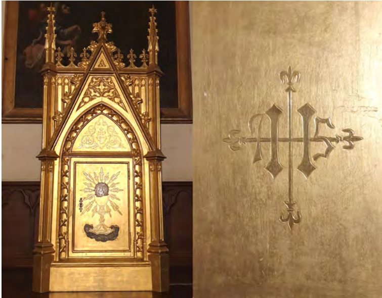
Figura 5: (a) Sagrari de Manacor semblant al de Fornalutx, (b) Anagrama similar de Jesús