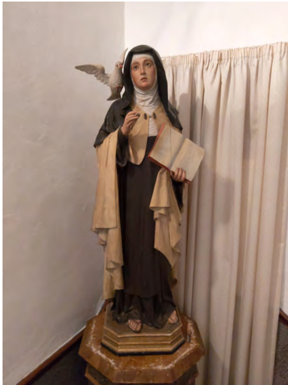
Figura 6: Santa Teresa procedent de la Caritat de Manacor