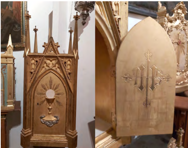
Figura 4: (a) Sagrari procedent de Fornalutx i (b) Decoració interior de la seva porta

El sagrari és d'estil neogòtic, tal com era el retaule, i mesura 86 cm d'alçària (figura 4a). Destaca per tenir quatre pinacles neogòtics que el fan més alt, però cal tenir present que, amb la creu inclosa, era més alt encara. A la porta té una al·legoria eucarística del calze amb la sagrada forma. A l'interior, a la porta, hi ha l'IHS, l'anagrama de Jesús (figura 4b).