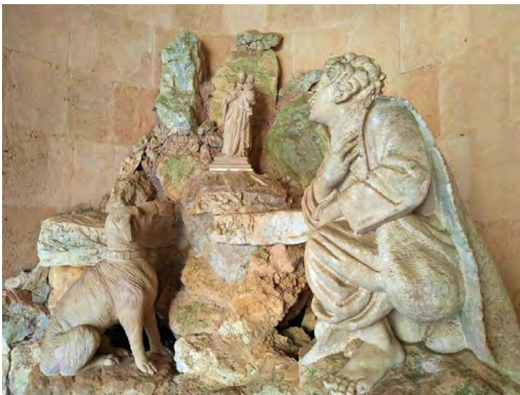
Figura 2: Conjunt de les imatges de Sa Capelleta

No cal explicar exhaustivament el que és sa Capelleta, ja que Mn. Cosme Bauçà i Mn. Pere Xamena (1991), com hem vist, ho expliquen perfectament en poques paraules: és el lloc, segons la tradició, on un pastor amb un ca varen trobar la imatge de la Mare de Déu de Sant Salvador.