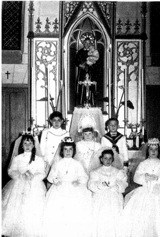
Figura 3: Retaule de la Caritat de Fornalutx