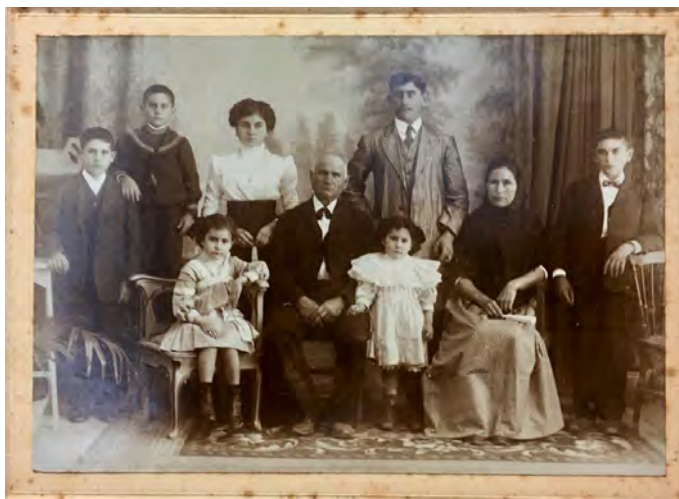
Figura 2. Família Adrover. Na Magdalena és la nina asseguda a primera fila.