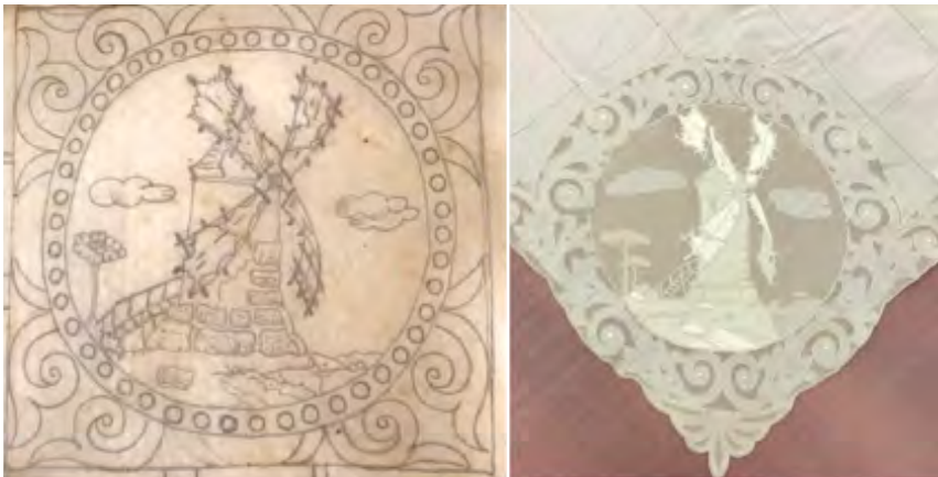
Figura 10: Dibuix preparatori del Molí (cortesia d'Elisa Cerdà) i detall del brodat de les estovalles

La mestria en l'execució i en la combinació de tècniques i fils blancs damunt el també blanc del teixit és tal que esdevé una escenografia pintada amb fil. Això s'aconsegueix gràcies a una percepció de perspectiva i un modelat obtingut pel joc de llum i ombres creat pel llustre, l'efecte tornassol i la densitat i gruix dels fils.