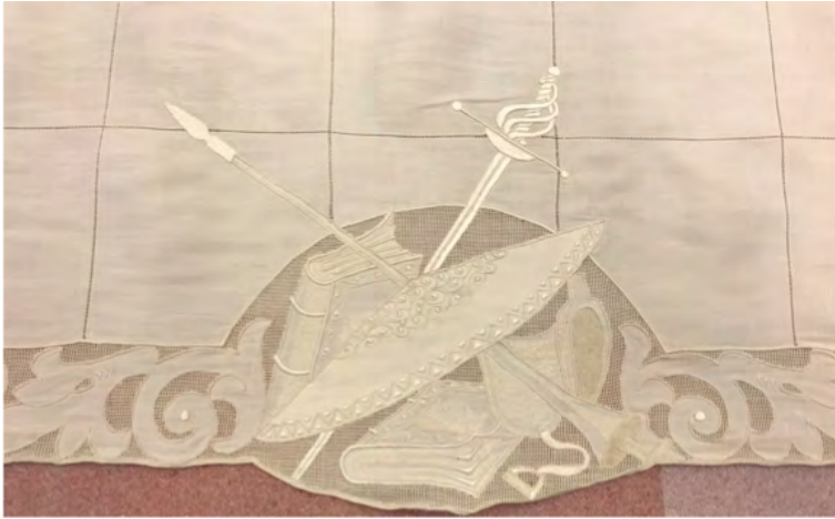
Figura 7: Detall central de la vora, amb les armes i emblemes del Quixot

Les estovalles, al museu, estan complementades per dotze torcaboques de forma quadrada. Sis d'ells repeteixen el perfil del Quixot, brodat a les estovalles, en una cantonada, els altres sis el de Sanxo.