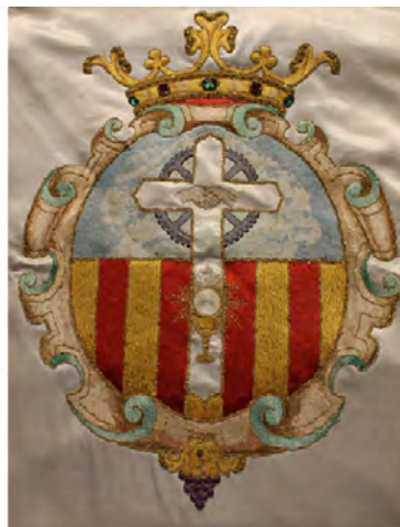
Figura 14. Disseny de l'escut i brodat a la bandera de la Germandat Cristiana Obrera.