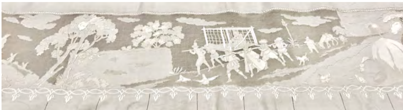
Figura 8. Detall de la iconografia. El Quixot dins la gàbia. Brodat de passat, de realç, garses i fil tret.

Les estovalles, al museu, estan complementades per dotze torcaboques de forma quadrada. Sis d'ells repeteixen el perfil del Quixot, brodat a les estovalles, en una cantonada, els altres sis el de Sanxo.