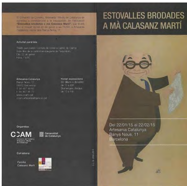
Figura 3. Díptic publicitari exposició Estovalles brodades a mà Calasanz Martí al Centre d'Artesania de Catalunya.

executats amb una gran varietat de tècniques de puntada i un grau de perfecció gairebé inimaginable.”