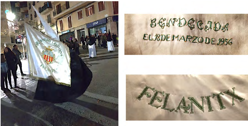
Figura 11. La Bandera a una processó de Setmana Santa i detalls d'algunes de les lletres brodades.