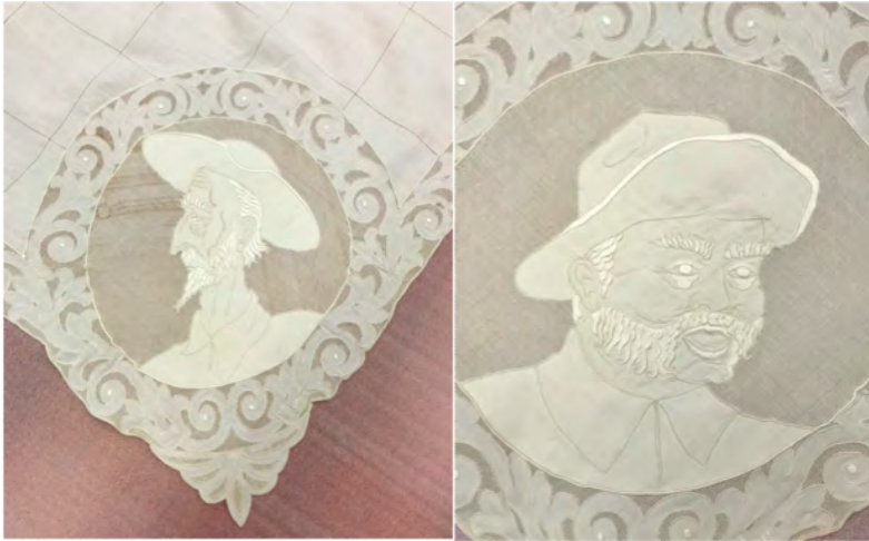
Figura 9. Detalls dels cornalons brodats dels torcaboques. Les cares dels personatges estan encerclades per roleus i fulles d'acant que s'estenen per adaptar-se al cornaló.