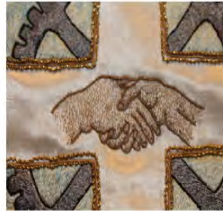
Figura 13. Anagrama de la Germandat i detall de la bandera.