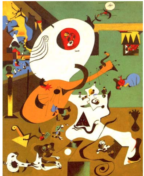
Figura 3: L'interior Holandés (Joan Miró - 1928)