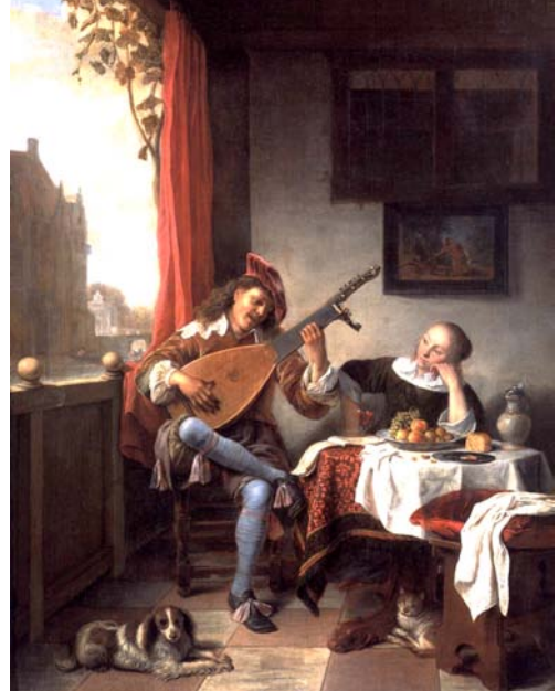
Figura 2: El tañedor de laúd (Hendrick Martensz Sorgh - 1661)

títol "Procés a Joan Miró" (Redacció 04/I/1969). Blai Bonet en aquestes dates estava escrivint un llibre sobre l'artista, subvencionat per la Fundació Meaght de França.